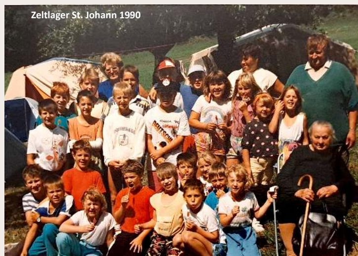
Zeltlager St. Johann 1990