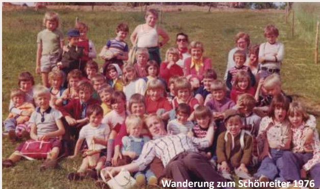
Wanderung zum Schönreiter 1976

Besonders stimmungsvoll wurde es in der Vorweihnachtszeit: Die Kinder probten Gedichte und Hirtenspiele, die sie anschließend beim Pensionistenverband vortragen durften – ein Moment großer Freude und Stolz, sowohl für die Kinder als auch für das Publikum. Selbstgebastelte Gestecke wurden liebevoll überreicht und trugen dazu bei, die Generationen miteinander zu verbinden.