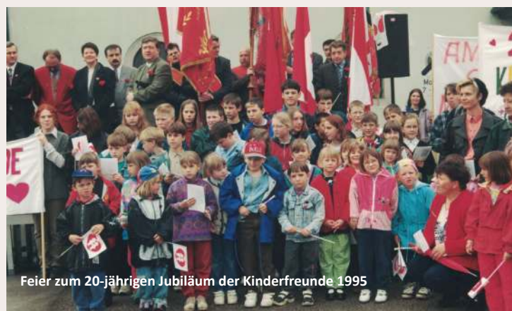
Feier zum 20-jährigen Jubiläum der Kinderfreunde 1995