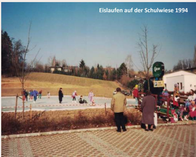
Eislaufen auf der Schulwiese 1994