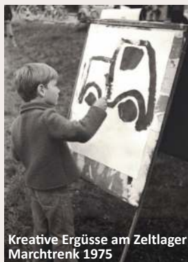
Kreative Ergüsse am Zeltlager Marchtrenk 1975