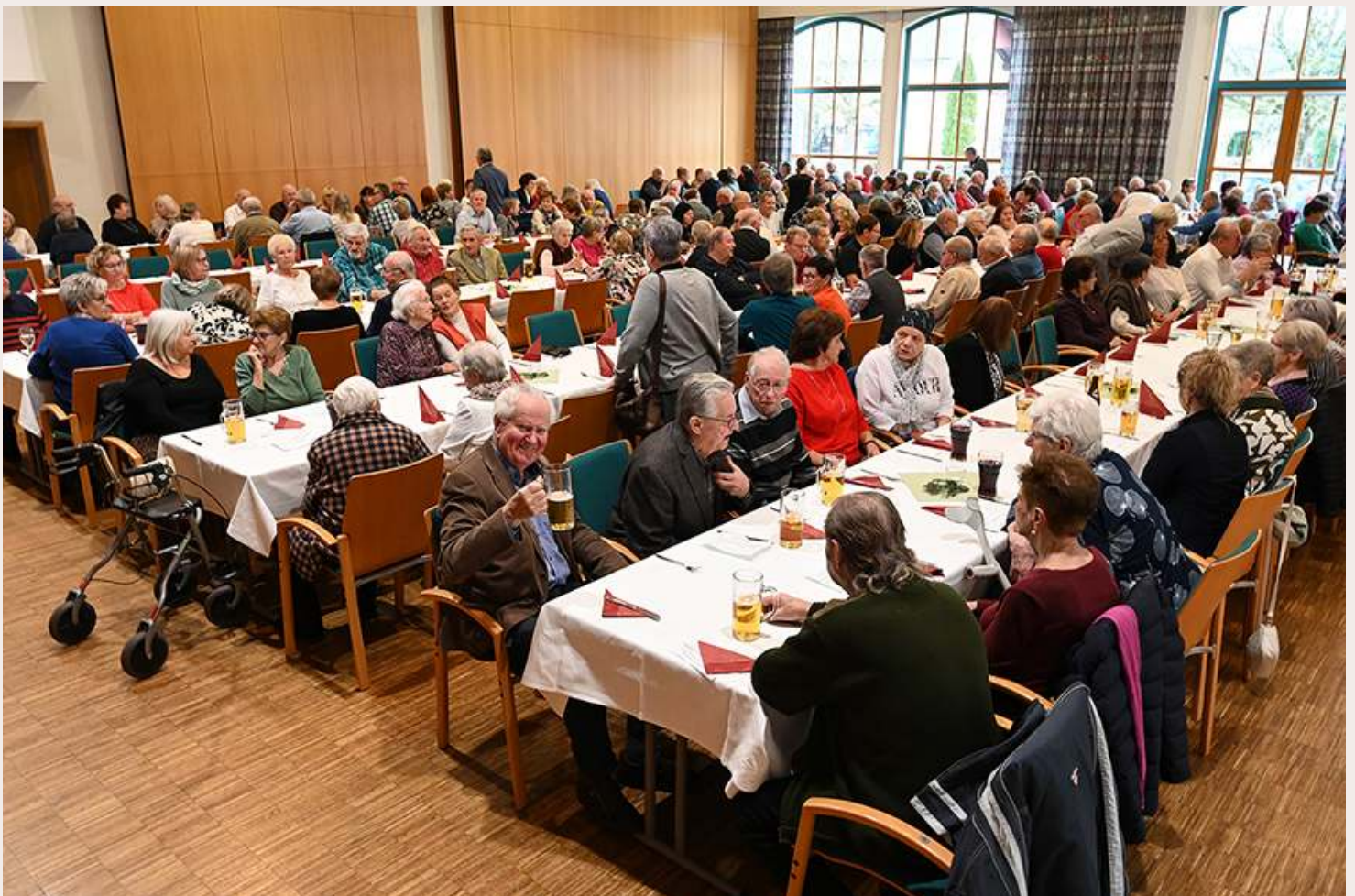
Die Weihnachtsfeier am 5. Dezember war der gesellschaftliche Höhepunkt