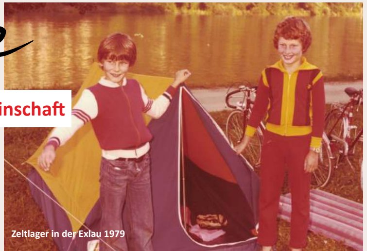
Zeltlager in der Exlau 1979

Schon bald begannen die ersten wöchentlichen Heimstunden. Es wurde gespielt, gebastelt, gesungen und gelacht.