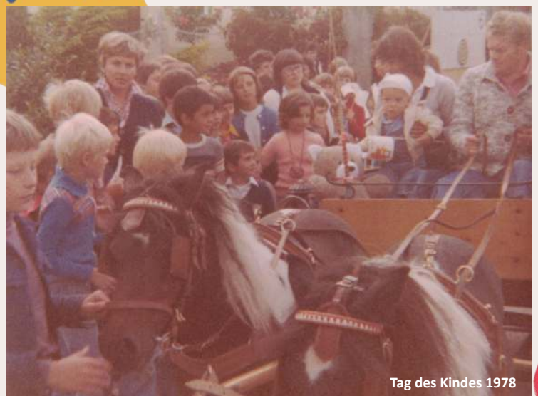
Tag des Kindes 1978

Bald entwickelte man einen Jahreskreis, der reich an Aktivitäten war: Kinderfasching, Schitage, Osternester-Suchen, Muttertagsfeiern, Pfingstlager in Obertraun, Zeltlager im Mühlviertel, Bootsfahrten auf der Donau – es war immer etwas los. Die Kinderfreunde sorgten dafür, dass kein Jahr ohne gemeinsame Erlebnisse verging.