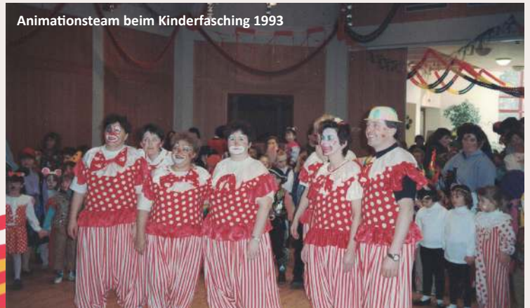
Animationsteam beim Kinderfasching 1993

Zu jedem Anlass – ob Ostern, Muttertag, Nikolaus oder Weihnachten – entstanden kunstvolle Bastelarbeiten. Die Kinder fanden Raum für Kreativität, Gespräche und gemeinsames Spiel – eine wertvolle Zeit, die viele prägende Erinnerungen hinterließ.